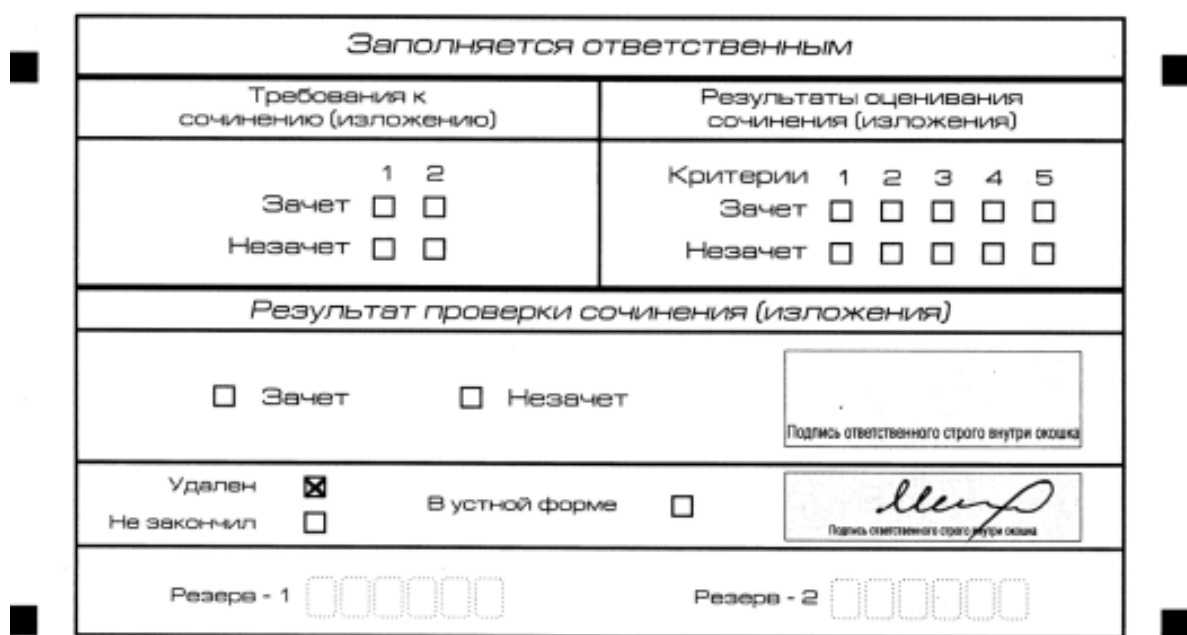
Рис. 11. Заполнение полей нижней части бланка регистрации (удаление с экзамена)

общего образования, утвержденного приказом Министерства просвещения Российской Федерации и Федеральной службы по надзору в сфере образования и науки от 4 апреля 2023 года № 233/552, он удаляется с итогового сочинения (изложения). Член комиссии по проведению итогового сочинения (изложения) составляет по форме ИС-09 «Акт об удалении участника итогового сочинения (изложения)», вносит соответствующую отметку в форму ИС-05 «Ведомость проведения итогового сочинения (изложения) в учебном кабинете ОО (месте проведения)» (участник итогового сочинения (изложения) должен поставить свою подпись в указанной форме). В бланке регистрации указанного участника итогового сочинения (изложения) необходимо внести отметку «X» в поле «Удален». Внесение отметки в поле «Удален» подтверждается подписью члена комиссии по проведению итогового сочинения (изложения) (рис. 11).