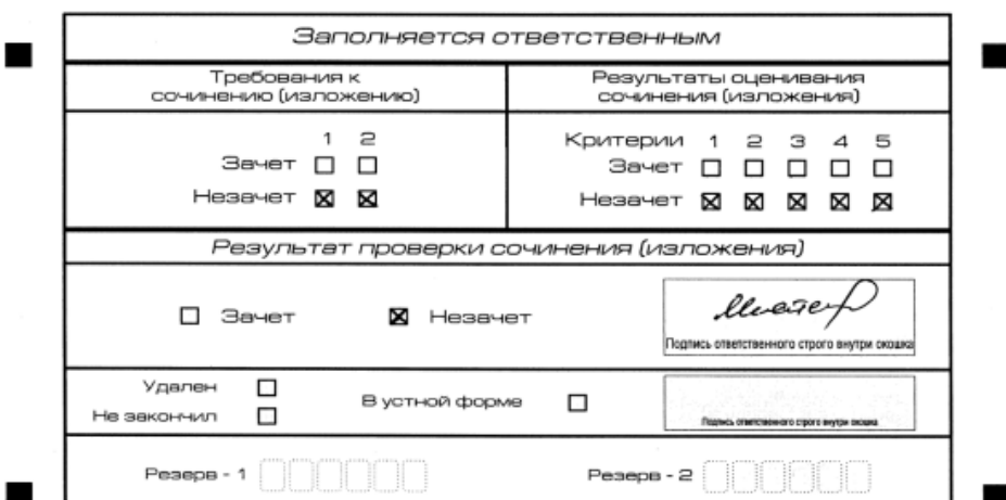
Рис. 6. Область для оценки работы

5.2.2. Требование № 2. «Самостоятельность написания итогового сочинения (изложения)».